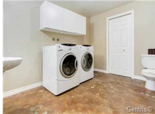
Salle de lavage